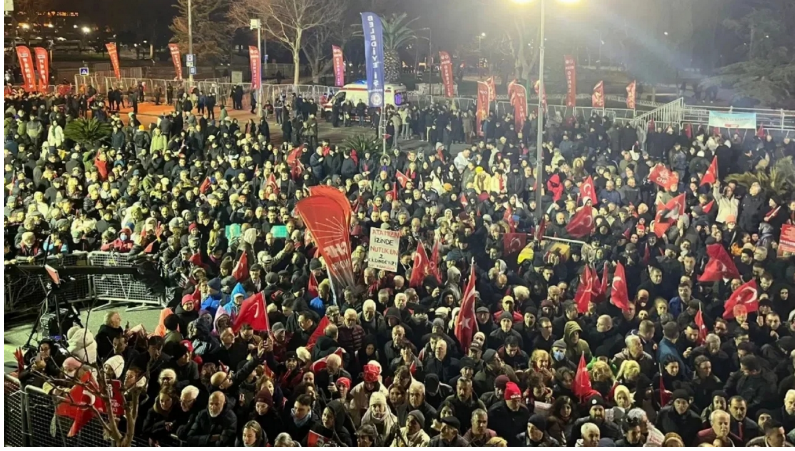
19 Mart'ın birinci yıl dönümünde Saraçhane'de miting

Mitinge sol grupların siyasi kortejleriyle katılmasının, CHP'ye açık siyasi desteklerinin birbirleriyle yarışır şekilde abartılı olmasını kaydedelim. DEM partinin temsili katılımını da hatırlatalım. İşçi sınıfının