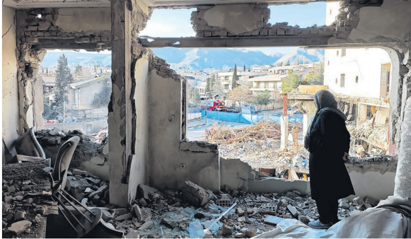
Tahran banliyösü, 21 Mart

Çünkü baskılar devam ediyor. Hapishaneler, emperyalizmin hizmetinde çalıştığı iddia edilen insanlarla doluyor. Savaş, milliyetçilik duygusunu güçlendiriyor ve her türlü muhalefetin yok edilmesini kolaylaştırıyor. Rejim, 18 Mart haftasında Fars yeni yılı olan Nevruz bayramı kutlamaları sırasında