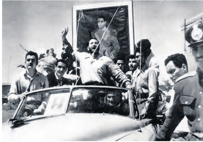
1953 darbesi sırasında askerler Şah'ın portresini sergiliyor.

İngilizler ve Amerikalılar, Mossadegh'in devrilmesini organize ettiler ve Şah'ın, yani Farsça'da kral anlamına gelen Şah'ın