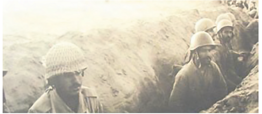
İran-İrak Savaşı sırasında bir siperdeki İranlı askerler.

güçler topluluğunda eşit bir şekilde kabul edilme arzularını yansıtmaktadır. Amerikalı liderlere gelince, onlar bir bölgesel gücü diğerine karşı desteklemekten hiç vazgeçmediler; her biri, sırasıyla Irak, Lübnan, Afganistan, Suriye veya İran'ı harap eden emperyalist müdahalelerin yarattığı kaos içinde kendi oyununu oynuyordu.