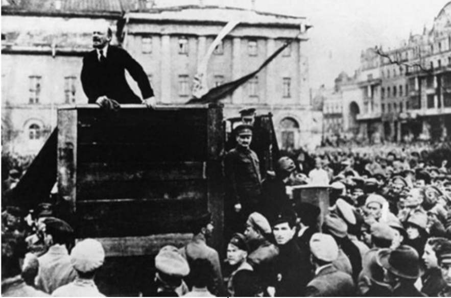
Lenin 1 Mayıs 1920'de Moskova'da

Lenin, 19. yüzyılın sonundan 1920'li yılların başına kadar, işçi hareketinin olağanüstü